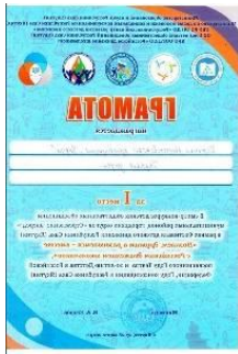
Смотр ДОО 1 место 2019г