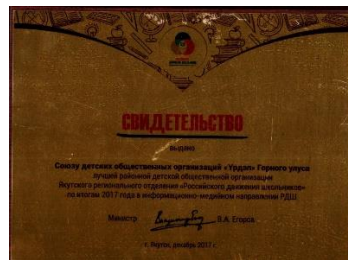
Лучшая ДОО РДШ в номинации Информационно-медийная 2017