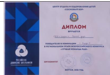
Диплом победителя в номинации Лидеры 2021г