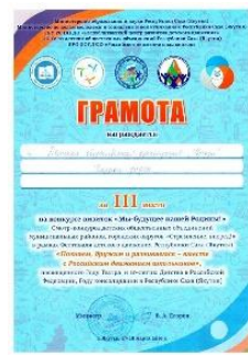
Конкурс визиток 3 место 2019г