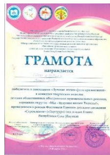
Лучшая видео фото презентация 2018г