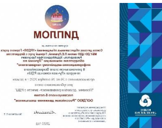
Лучшая ДОО РДШ в номинации Информационно-медийная 2020