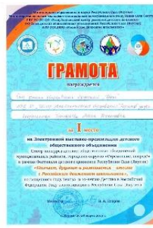
Электронная выставка презентации 1 место 2019г