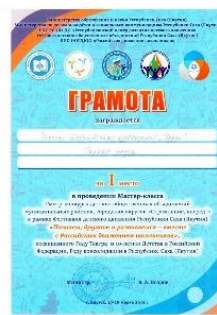
1 место за проведение мастер класса 2019г