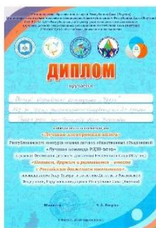
Лучшая электронная книга 2019г