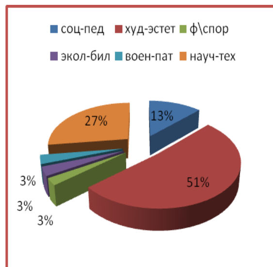
Сведения об охвате воспитанников за 3 года